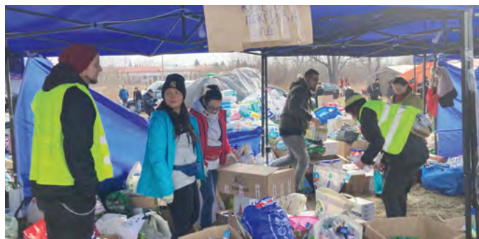
In vielen Ländern (wie hier in Polen) unterstützt ADRA die Geflüchteten aus der Ukraine.

Mit dem Beginn des neuen Schuljahres hat ADRA Moldawien in der Region Transnistrien, in der viele Flüchtlinge aus der Ukraine leben, mit außerschulischen Aktivitäten für Kinder begonnen. Das Hilfs- und Informationszentrum für Flüchtlinge in Tiraspol, das von ADRA Moldawien getragen wird, bietet Jugendlichen Raum für interaktive und Freizeitaktivitäten sowie für Hausaufgaben.