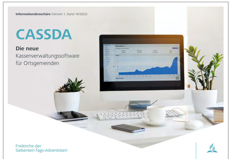
Diese Broschüre, die im Oktober versandt wurde, enthält alle notwendigen Informationen über die neue Kassenverwaltungssoftware für Ortsgemeinden.