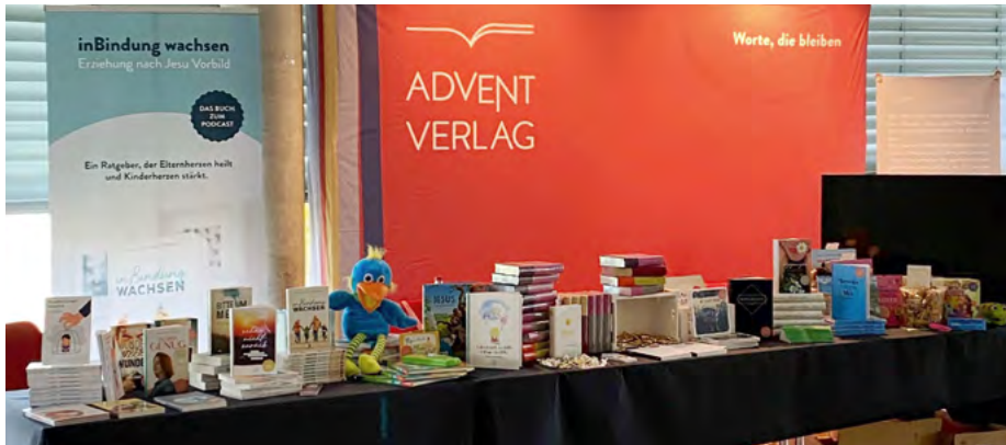
Ein Büchertisch ist eine Quelle geistlicher Inspiration (hier der Stand des Advent-Verlags beim Frauen-DACH-Kongress).

Erleichterungen durch die Software CASSDA