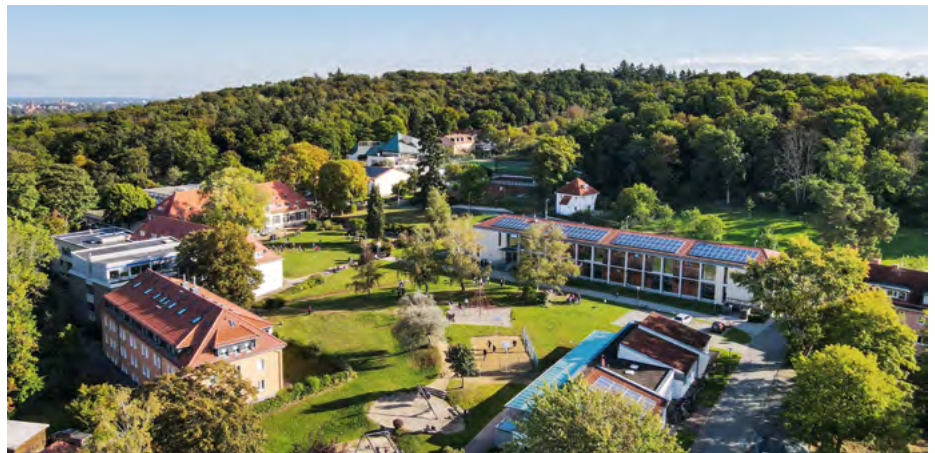
Der Campus des Schulzentrums Marienhöhe in Darmstadt – ein Ort voller Teenager.