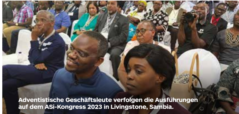
Adventistische Geschäftsleute verfolgen die Ausführungen auf dem ASi-Kongress 2023 in Livingstone, Sambia.

Eine der Gastrednerinnen war die erste Bürgermeisterin der Stadt Livingstone. Constance Nalishebo Mukelebai dankte der Kirche der Siebenten-Tags-Adventisten in Sambia dafür, dass sie das Leben in den Bereichen Bildung und Gesundheit verbessert. „Die Regierung Sambias