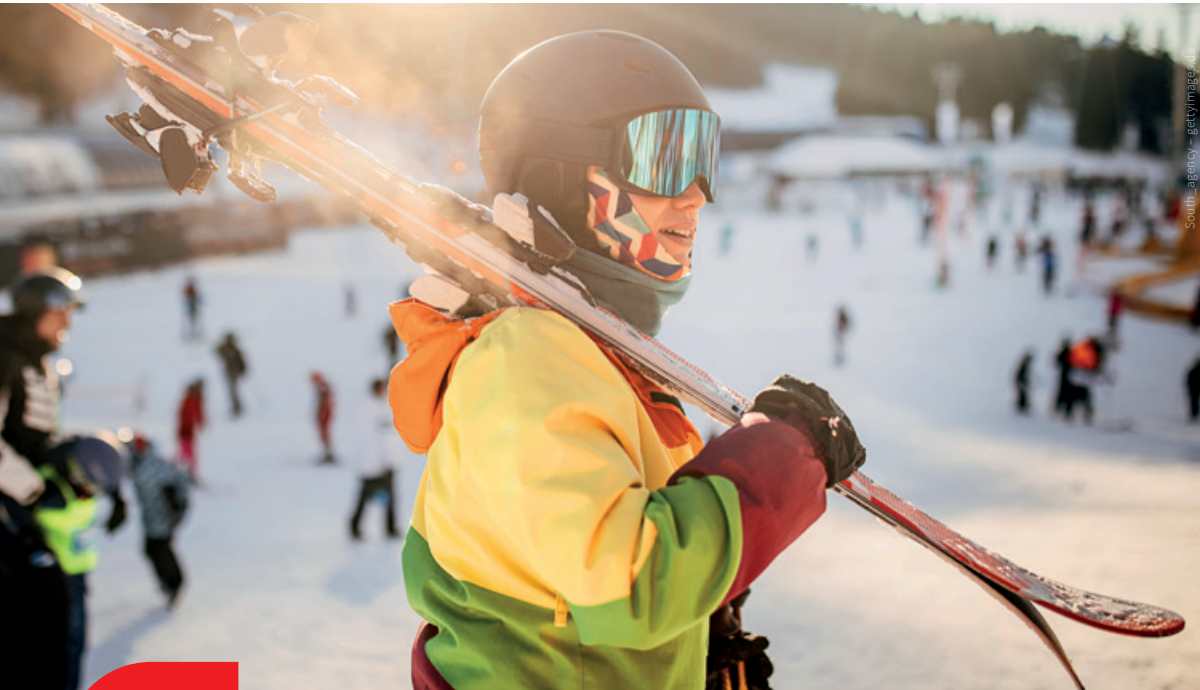
Sportliche Aktivität steht u. a. mit besserer Denkfähigkeit in Zusammenhang.